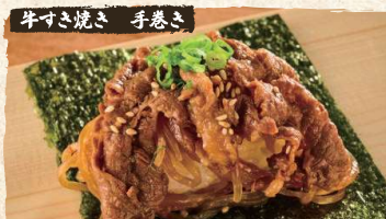
Beef Sukiyaki Roll $5.90