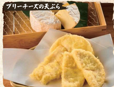
Brie Cheese Tempura (4pc) $5.50