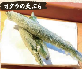
オクラの天ぷら Okra Tempura (3pc) $4.90