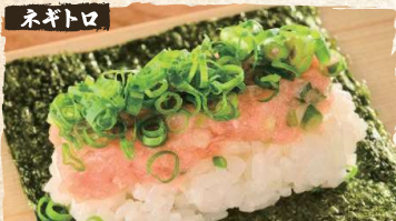
Negitoro Roll $4.90