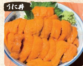
うに丼 Uni Bowl $45.00