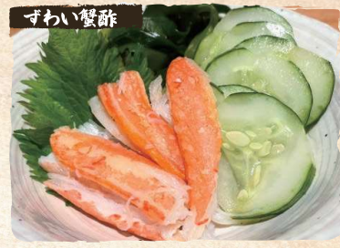
ずわい蟹酢 Snow Crab with Vinegared Greens $16.90