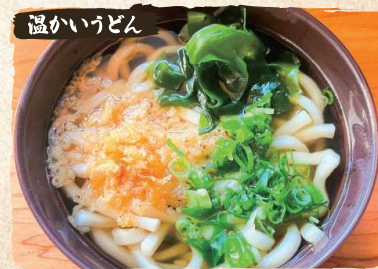
温かいうどん Udon Noodles $8.50

Consuming raw or undercooked meats, poultry, seafood, shellfish, or eggs may increase your risk of foodborne illness, especially if you have certain medical conditions.