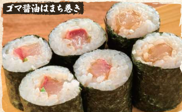
Hamachi Sesame Soy Sauce Rolls $5.90