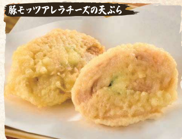
Pork, Mozzarella Cheese Tempura (2pc) $6.50