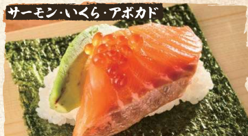
Salmon Ikura Avocado Roll $7.50