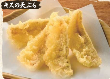
キスの天ぷら Kisu Tempura (Sand-borer Fish) (4pc) $6.90