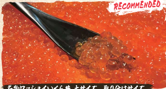
名物ワッショイいくら丼 大サイズ 取り分けサイズ Wasshoi Ikura Bowl Large Size (Easy to share) $59.00