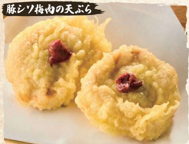
Pork, Ume Shiso Tempura (2pc) $6.50