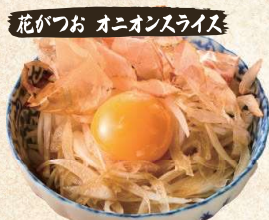
花がっお オニオンスライス Sliced Onion with Dried Bonito, Ponzu sauce $4.90