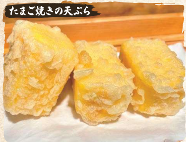
Egg Omelette Tempura (3pc) $5.90