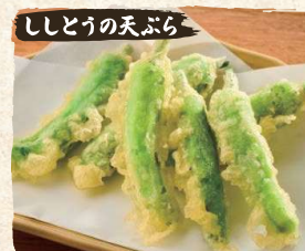
ししとうの天ぷら Shishito Pepper Tempura (5-7pc) $4.90