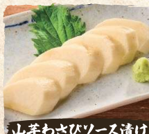
山芋わさびソース漬 Wasabi marinated Yamaimo $5.90