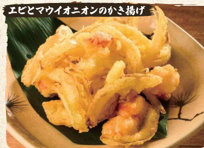
Shrimp and Sweet Onion Mixed Kakiage Tempura $6.90