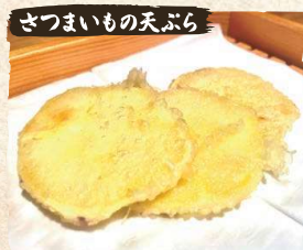
さつまいもの天ぷら Sweet Potato Tempura (3-4pc) $4.90