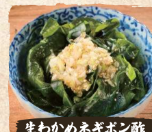
生わかめネギポン酢 Fresh Wakame Seaweed Ponzu $3.90