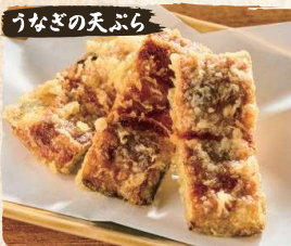
うなぎの天ぷら Eel Tempura (3pc) $6.90