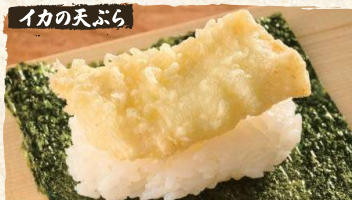
Squid Tempura Roll $4.90