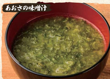
あおさの味噌汁 Aosa Nori Miso Soup $3.90