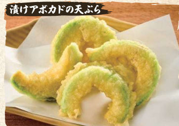
漬けアボカドの天ぷら Dashi Marinated Avocado Tempura (4pc) $5.90