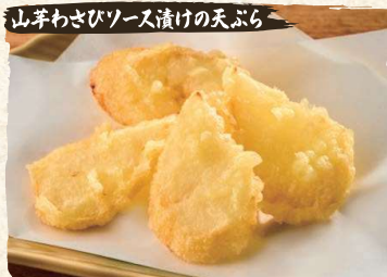
山芋わさびソース漬けの天ぷら Wasabi Sauce Marinated Yamaimo Tempura (4pc) $4.90