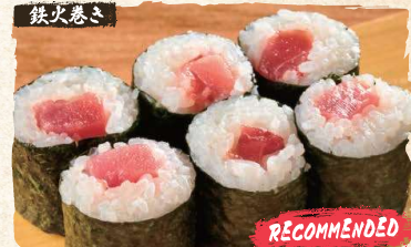
Tuna Rolls $5.90