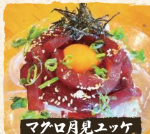
マクロ目見ユッケ Fresh Tuna Tsukimi Yukhoe $13.90