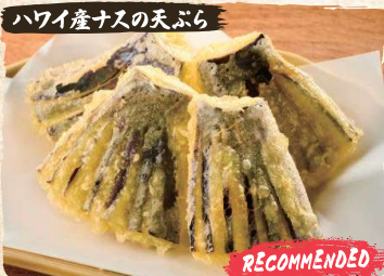
ハワイ産ナスの天ぷら Local Egg Plant Tempura (4pc) $4.90