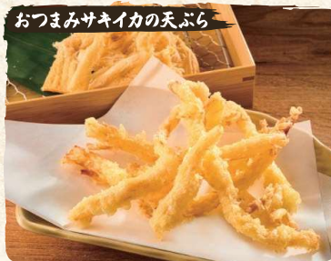
Saki Ika (Squid Snack) Tempura $3.90