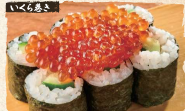
Ikura Rolls $7.50