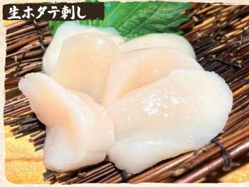
生ホタテ刺し Fresh Scallop Sashimi (From Japan) $15.90