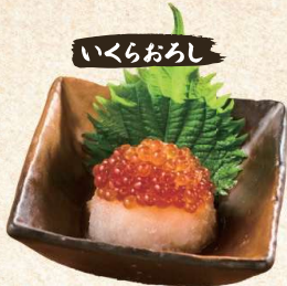
いくらおろし Ikura Shredded Daikon $6.90