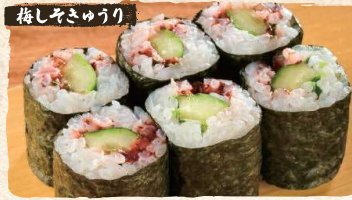
Ume Shiso Rolls $3.90