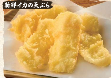
新鮮イカの天ぷら Fresh Squid Tempura (4pc) $6.90