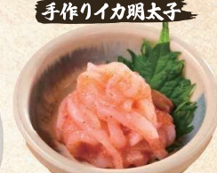
手作りイカ明太子 House made Squid & Mentaiko Cod Roe $6.90