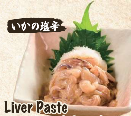
いかの塩辛 Liver Paste Marinated Raw Squid $4.90