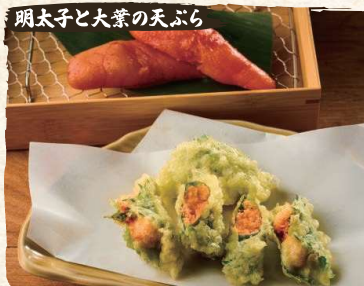
Shiso Wrapped Mentaiko (Cod Roe) Tempura (4pc) $7.50