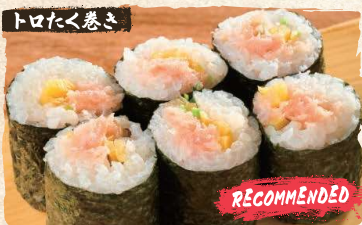
Torotaku Rolls $4.90