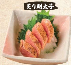
炙り明太子 Seared Mentaiko Cod Roe $6.50