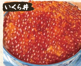
いくら丼 Ikura Bowl $22.00