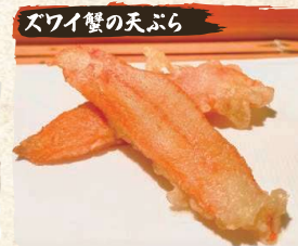
ズワイ蟹の天ぷら Snow Crab Leg Tempura (2pc) $11.90