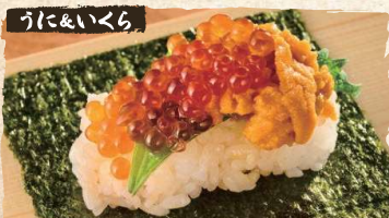
Uni, Ikura Roll $9.90