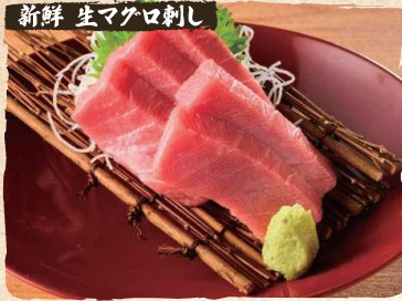
新鮮 生マグロ刺し Local Catch, Fresh Tuna Sashimi $14.90