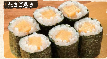
Egg Omelet Rolls $3.90