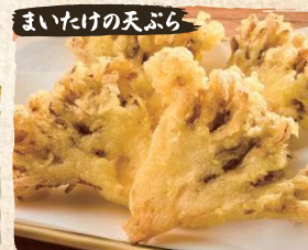
まいけの天ぷら Maitake mushroom Tempura (3-4pc) $4.90