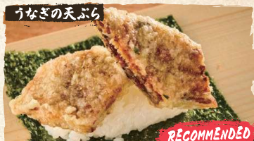
Eel Tempura Roll $6.50