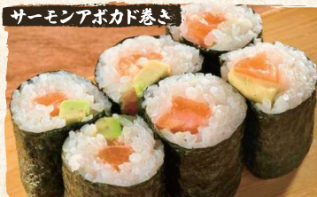
Salmon Avocado Rolls $4.90