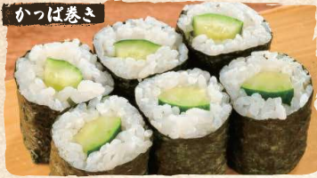
Cucumber Rolls $3.00