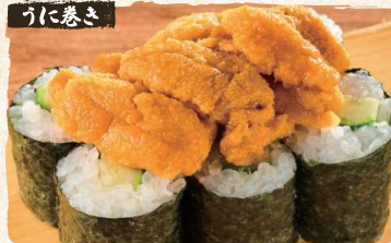
Uni Rolls $13.90