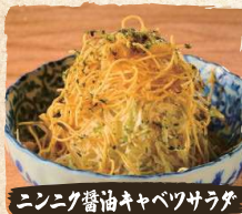
ニンニク醤油キャベツサラダ Garlic Shoyu Cabbage with Crispy Noodles $4.90