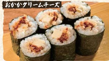
Dried Bonito, Cream Cheese Rolls $3.90