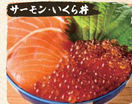
サーモン・いくら丼 Ikura & Salmon Bowl $17.50