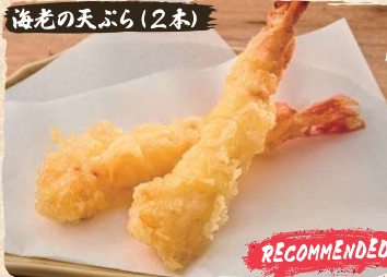
海老の天ぷら (2本) Shrimp Tempura (2pc) $6.50