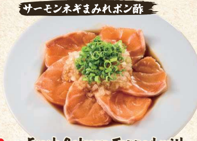
サーモンネギまみれポン酢 Fresh Salmon Topped with Green onion & Ponzu $12.00