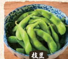
枝豆 Boiled Soybeans $3.90