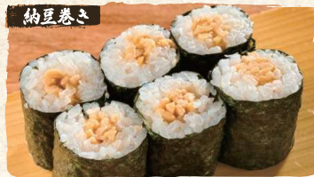
Natto Rolls $3.90