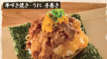
Beef Sukiyaki, Uni Roll $9.50