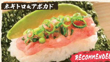
Negitoro Avocado Roll $5.90