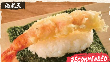
Shrimp Tempura Roll $4.90