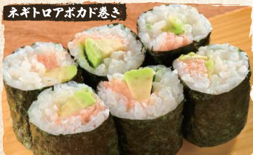
Negitoro Avocado Rolls $4.90