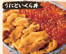
うにといくら丼 Ikura & Uni (Sea Urchin) Bowl $29.00