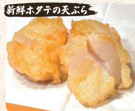
新鮮ホタテの天ぷら Fresh Scallop Tempura (from Japan) (2pc) $9.90