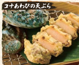
コナあわびの天ぷら Kona (Big Island) Abalone Tempura $8.90