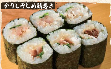
Mackerel Ginger Shiso Rolls $4.90

Consuming raw or undercooked meats, poultry, seafood, shellfish, or eggs may increase your risk of foodborne illness, especially if you have certain medical conditions.