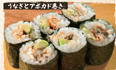
Eel Avocado Rolls $6.90