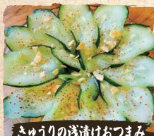
さゆりの浅漬けおつまみ Cucumber Pickles $4.50