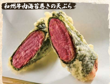
American Wagyu Beef Nori Rolled Tempura (2pc) $7.50