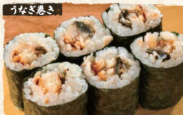
Eel Rolls $5.90